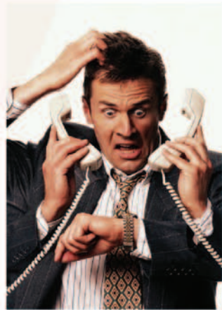
改变“抑郁”和 “焦虑”的习惯