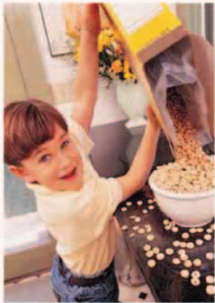
营造多动症儿童的 健康成长环境